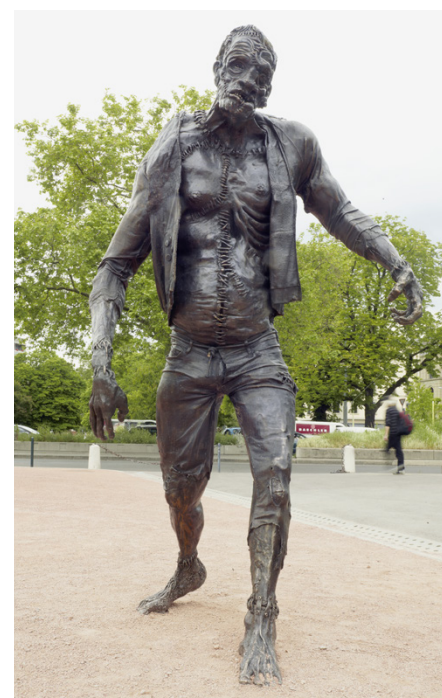
Fig 02. KLAT, Frankie a.k.a. The Creature of Doctor Frankenstein, 2013-2014

Le groupe d'artiste KLAT s'est approprié l'histoire de la créature de Frankenstein – personnage créé à Genève par l'auteure britannique Mary Shelley en 1816 – pour en proposer une lecture inédite et contemporaine. Ce bronze rend hommage à la figure du vagabond et du marginal. KLAT use ainsi des codes traditionnels de la statuaire publique honorifique pour célébrer non pas le pouvoir ou la réussite, mais la différence et l'humanité dans sa complexité. Les artistes abolissent également les frontières entre fiction et réalité en plaçant la sculpture au même niveau que des figures historiques telles que le Général Dufour et Jean-Jacques Rousseau.